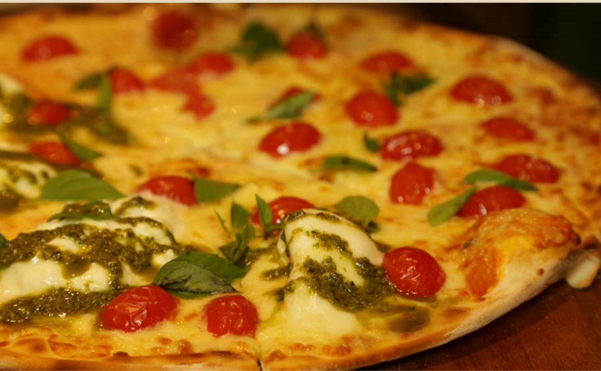
PIZZA BURRATA AO MOLHO PESTO E MARGHERITA