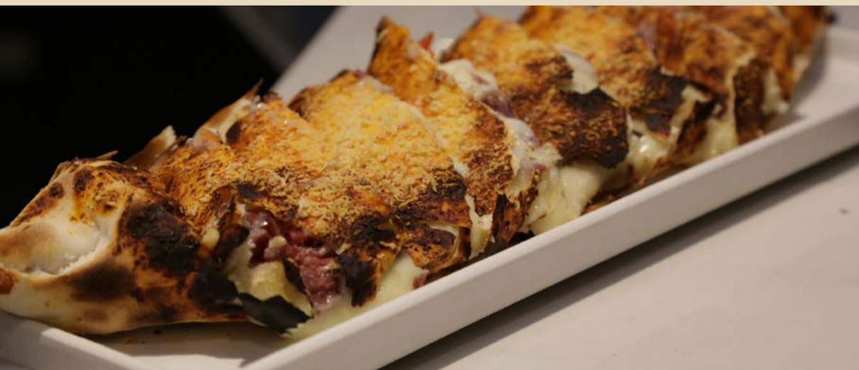
STICK CARNE DE SOL